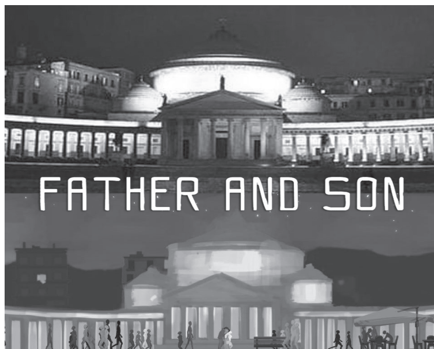
Fig. 6.3 Scorcio di Piazza del Plebiscito a Napoli e della sua trasposizione videoludica su Father and Son.

di 525.687 presenze alla fine del 2017 (+16,2% rispetto all'anno precedente) ed è interessante notare come proprio in corrispondenza della pubblicazione del videogioco (aprile 2017) si sia registrato il primo notevole incremento degli accessi (dati MANN, 2018; Fig. 6.4). In meno di un anno il videogioco è stato scaricato quasi 2 milioni di volte da utenti internazionali e circa 18.450 persone hanno registrato la propria presenza al MANN, riuscendo a sbloccare i contenuti aggiuntivi citati (dati Associazione TuoMuseo, 2018). Il videogioco ha acquisito popolarità nel mondo del web anche grazie alle review dei giocatori (circa 18.000 con un punteggio in media di 4,7 su 5) e alla straordinaria visibilità dello stesso sui social network più diffusi (Facebook e Twitter) e sulla free press («La Freccia» magazine dell'alta velocità e «Note» del trasporto regionale Trentitalia).