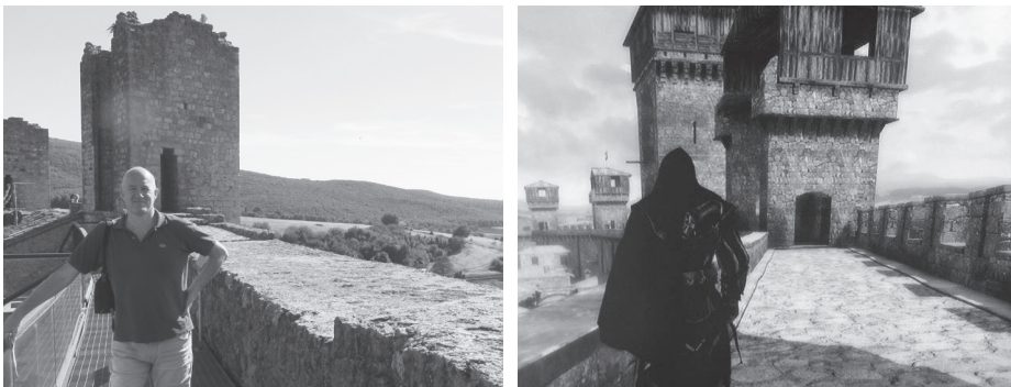
Fig. 6.1 Scorcio delle mura di Monteriggioni e della loro trasposizione videoludica su Assassin's Creed .